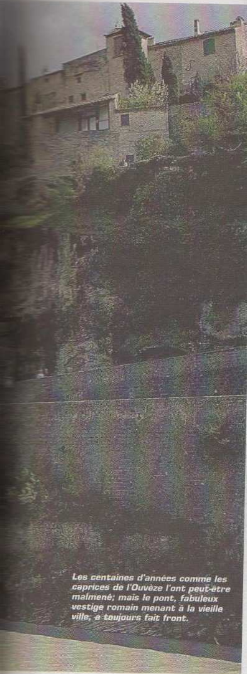
Les centaines d'années comme les caprices de l'Ouvèze l'ont peut-être malmené; mais le pont, fabuleux vestige romain menant à la vieille ville, a toujours fait front.

l'Abbé Sautel, les ruines antiques révèlent deux sites archéologiques, probablement des quartiers résidentiels : Puymin et la Villasse. Des fouilles, surgissent colonnes, des sains de maisons patriciennes (dont "La Tonnelle" sur une surface de 3 000 m 2 ), thermes, boutiques ("La rue des boutiques" à voir à la Villasse) et jardins, témoins de l'opulence de la cité. Sans oublier l'imposant Théâtre Antique (6 000 places), écrin du festival de Vaison, entièrement restauré en 1927. Construit au moment de l'apogée de l'empire (en l'an 120 après Jésus-Christ), on présume la somptuosité du théâtre, comme l'attestent objets et statues découverts dans ses fosses. Enfin, le Pont Romain, avec son unique arche de 17 mètres de haut, traverse les âges jusqu'à la cité médiévale, fièrement dressée sur un éperon rocheux, depuis le XIII e siècle.